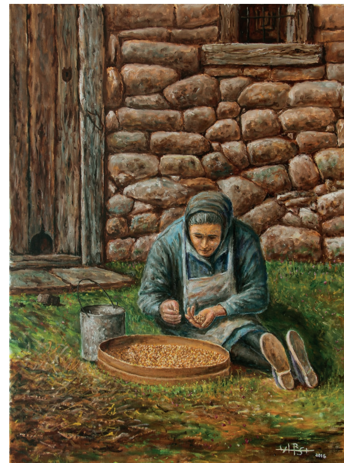
«ESMOTANDO GARBANZOS» - PINTOR «DE LA ROSA»